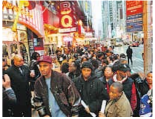
NEUE YORK (EE.UU.)