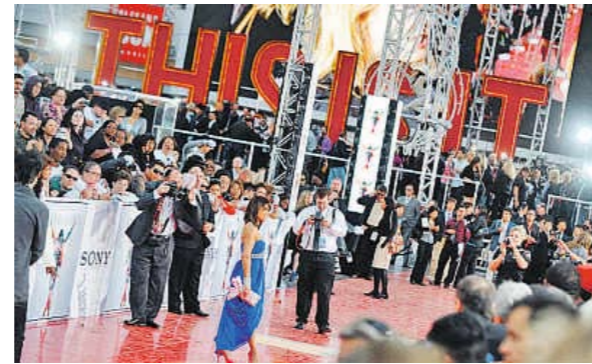
Paula Abdul llega a la gala en el teatro Nokia de Los Ángeles

Desde que la alfombra roja fue habilitada a plena luz del día, quedó claro que la idea era celebrar la extraordinaria vida de Jackson, y no llorar su muerte. Los bailarines que con ropa similar a la que usaba el bailarín, repleta de brillos y atrevidas superposiciones de accesorios, colgaban de