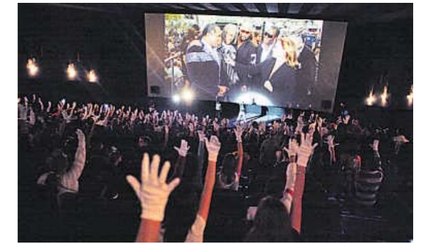
Coreografía de los fans enguantados en la première de Madrid

El coreógrafo y director Kenny Ortega ha evitado escenas de patetismo —que un grupo de fans asegura que se produjeron durante los ensayos (y, viendo al flaquísimo Jackson, no hay motivo para dudar)— y se ha limitado a levantar un facsímil de lo que iba a ser el regreso del rey del pop. Al Jackson que retrata Ortega le falta músculo y a veces resuello, pero no se le ha atrofiado el oído ni el ritmo. Es ese personaje cándido, frágil al