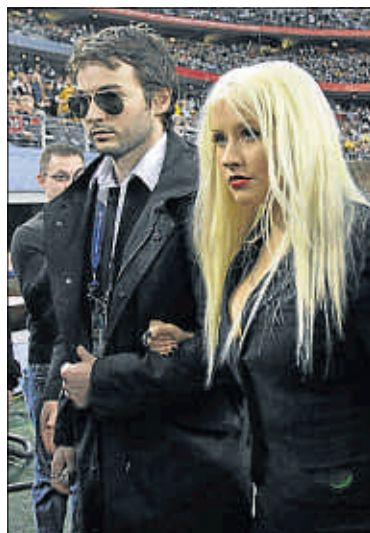
La pareja, el 6 de febrero

gún comentario respecto a esta nueva polémica. La detención por embriaguez llega un mes después de que la artista saliera en todos los medios por equivocarse en la letra del himno de EE.UU. en la Super Bowl. En un comunicado enviado por su publicista, Aguilera explicó que estaba tan emocionada en el momento de actuar que se perdió. "Sólo espero que todo el mundo pudiera sentir mi amor por este país y que pudiera transmitir el verdadero espíritu del himno", afirmó. / Efe