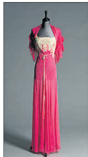
Tres delicados camisonos de chiffon

Lencería, bolsos, maletas y joyas de Wallis Simpson –la divorciada por la que Eduardo VIII renunció al trono británico en 1936 en favor de su hermano Jorge VI– se subastarán en Londres el 17 marzo. Los precios van desde las 300 y 12.000 libras (350 y 14.130 euros) y tras el éxito de El discurso del rey y que Madonna haya dirigido W.E. basada en la vida de los duques de Windsor, augura un éxito para la fundación infantil Dodi Fayed.