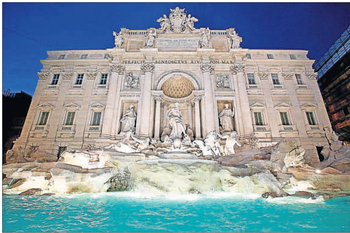
El agua volvió a brotar ayer en la monumental fuente, que ha recuperado su blancura original

La barroca Fontana de Trevi, una de las principales atracciones turísticas de Roma, fue reabierto oficialmente ayer tras someterse a una restauración que se prolongó 17 meses y que ha devuelto toda la blancura y esplendor original del espectacular monumento. Limpiar la fuente del siglo XVIII, que está integrada en la fachada del renacentista palacio Poli, ha costado más de dos millones de euros, que fueron aportados por la firma de moda Fendi, que también sufragó la renovación de las Quattro Fontane y que prevé pagar asimismo la restauración de otras cuatro fuentes romanas, entre ellas la también monumental e icónica Fontanone dell'Acqua Paola o del Gianicolo.